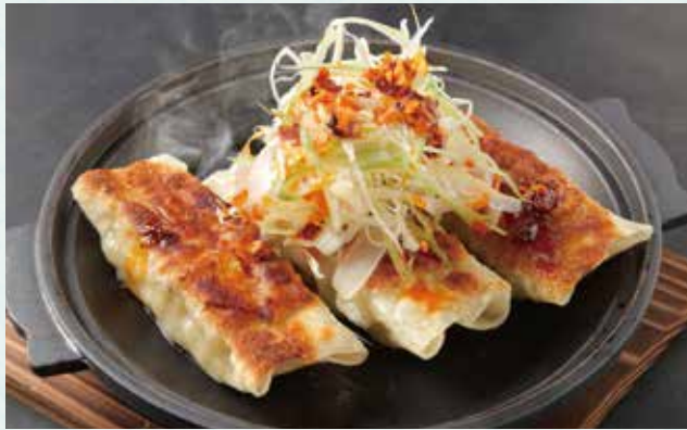
鉄板餃子 ¥1,000 Grilled gyoza