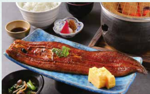
うなぎ炙り御膳 ¥3,980 (うなぎ炙り / ごはん / 小鉢 / 香の物 / 味噌汁) Lightly seared eel (Unagi) meal set (Unagi/Steamed rice/Small side dish/Pickles/Miso soup)