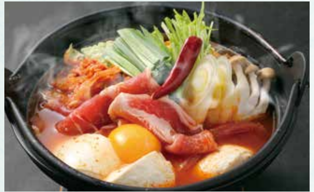
スンドゥブチゲ ¥1,400 Spicy soft tofu stew