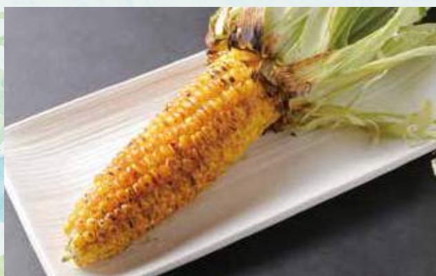
焼きとうもろこし ¥1,100 Grilled Corn お客様ご自身で焼き上げていただきます。 Please grill it yourself using charcoal.