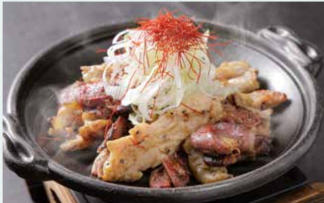
鉄板鶏炭火焼き ¥1,100 Sizzling charcoal-grilled chicken