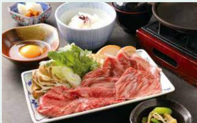
足柄牛すき焼き御膳 ¥2,900 (足柄牛 / ご飯 / 小鉢 / 香の物 / 味噌汁) Ashigara beef sukiyaki meal set Ashigara Beef/Steamed rice/Small side dish/Pickles /Miso soup