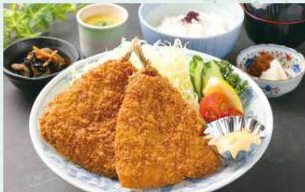
鱈フライ御膳 ¥2,000 (鱈フライ / ごはん / 小鉢 / 香の物 / 味噌汁) Fried horse mackerel meal set (Fried horse mackerel/Steamed rice/Small side dish/Pickles/Miso soup)