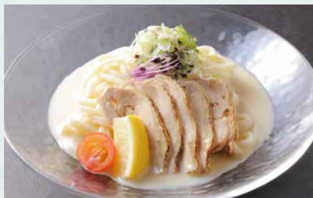
冷やし鶏出汁うどん ¥1,600 Chilled udon noodles in chicken broth