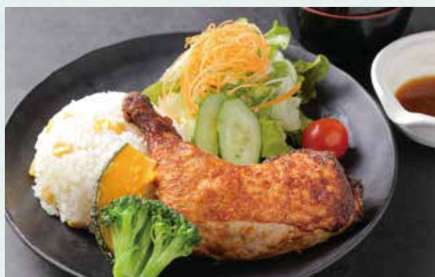
骨付き鶏もも肉の唐揚げ ~森の飯プレート~ Japanese fried chicken leg with rice, miso soup ¥1,900

※お車を運転されるお客様及び未成年者へのアルコールの提供はいたしておりません。 ※We don't serve alcohol to drivers.