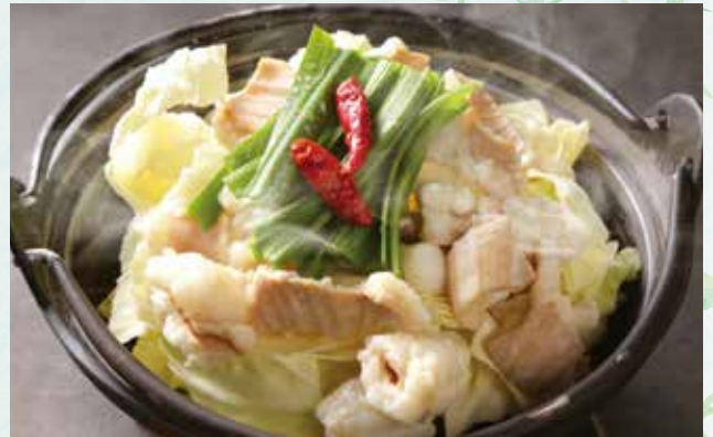
牛もつ鍋 ¥1,600 Beef offal hot pot (Per person)